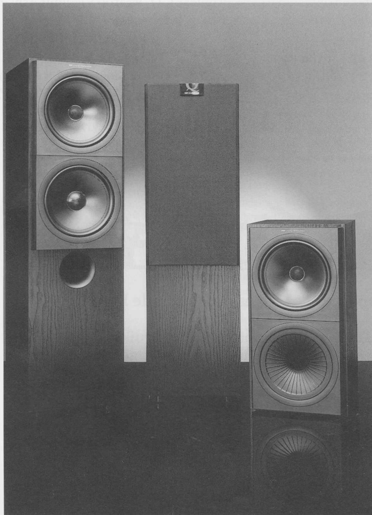
Q-60 luidsprekers (rechts op de foto)

C ONCLUSIE. Wat mij betreft is dit een set om iedereen aan te raden, of men nu instapt op beginners- of gevorderden niveau. Prettig en rustig vormgegeven, comfortabel te bedienen, voldoende mogelijkheden, uitnemende prijs / kwaliteitverhouding. Eventueel aangevuld met een platenspeler echt een installatie om jarenlang probleemloos van te genieten. Die vijfhonderd gulden setkorting kan mooi besteed worden aan muziek. ■